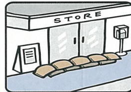
家屋、店舗、車庫等の浸水防止