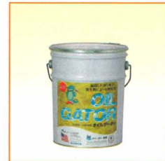
3kg入りペール缶 定価8,000円(税別)