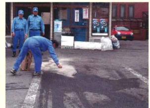
舗装面へこぼれた油の除去