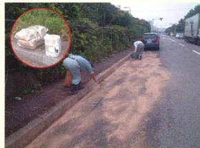
飛散したオイルにオイルゲーターを散布し、オイルを吸着させている状況。