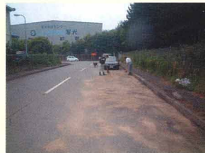
オイルを吸着したオイルゲーターを回収している状況。