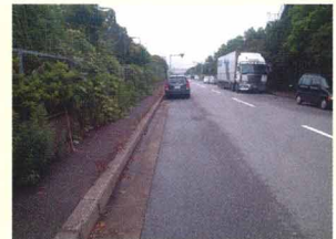
回収処理後の状況。 雨が降っても油膜は発生せず。