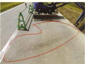
バックホーの作動油のホースが破裂して、舗装の上に漏れている。