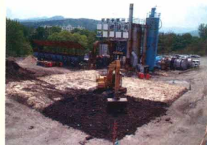
油が含まれた土壌の改良