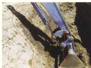
バックホーの作動油のホースが破裂して、内法面上に漏れた状況。