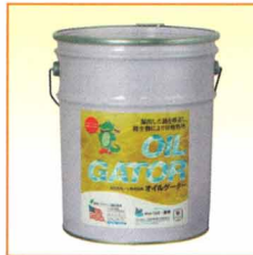
6kg入りペール缶 定価12,000円(税別)