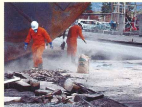
重油の流出処理にも有効