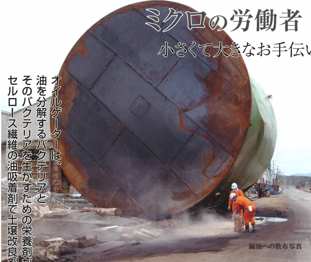
漏油への散布写真

オイルゲーターは、油を分解するバクテリアとそのバクテリアを生かすための栄養剤が入ったセルロース繊維の油吸着剤で土壌改良剤に最適です。