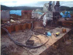
特殊油圧機械の油圧ホース破損により作動油流出