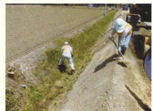
土水路の中に作動油がこぼれたのでオイルゲーターを使用し、早期処理を行い、油分の流出を防いだ。 (作動油7リットル程度にオイルゲーターを4kg程度撒き処理)