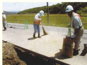
舗装に漏れた作動油に現場で備蓄していたオイルゲーターを撒き、油吸着させている状況。