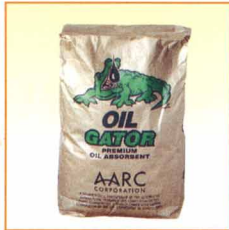
12kg入り原袋 定価18,000円(税別)