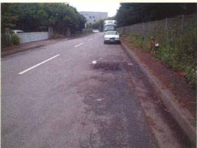
違法駐車車両からの油漏れ。 舗装面にオイルが飛散している状況。